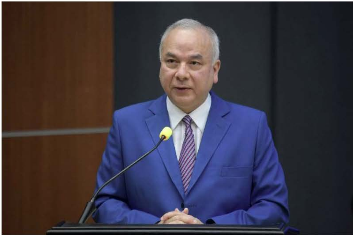
KUALA LUMPUR, 18 Nov -- Sultan Perak Sultan Nazrin Shah berkenan menyampaikan Titah Amanat pada Majlis Titah Diraja 2021 bertemakan 'Shaping A New Generation of Malaysian Diplomats' di Institut Diplomasi Dan Hubungan Luar Negeri hari ini.

KUALA LUMPUR: Generasi baharu diplomat perlu memahami sejarah, sains dan mendukung diplomasi digital dalam menjalankan tugas mereka ketika mewakili Malaysia di luar negara, titah Sultan Perak Sultan Nazrin Shah.